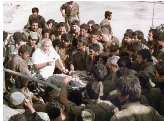
אריאל שרון כשר ביטחון עם חיילים בשטח