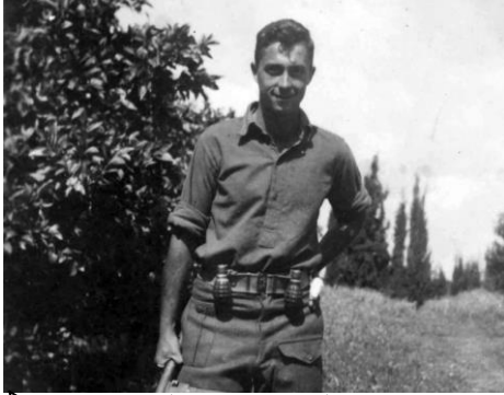
שרון כחייל בחטיבת אלכסנדרוני

בשנת 1945 הצטרף להגנה . במלחמת העצמאות שירת בפלמ"ח כמפקד מחלקה בחטיבת אלכסנדרוני .