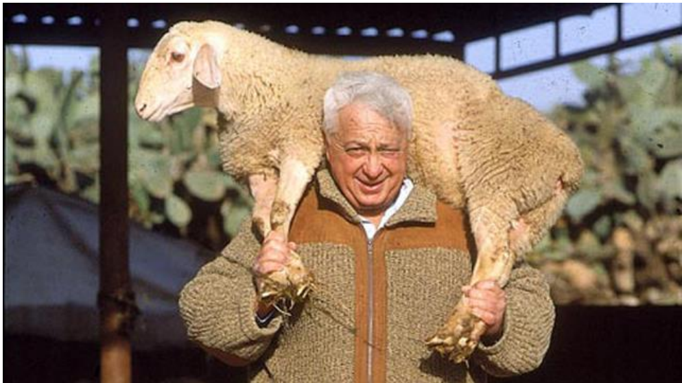
אריאל שרון בחוות השקמים