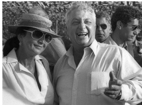
אריאל שרון עם רעייתו לילי